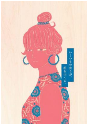
「あいにいこう」ビジュアル

ストアコンセプト「あいにいこう」をテーマに、人と人、人とモノ、様々な「会う」を通して生まれる楽しいこと・価値を発信してきました。かもめ広場では、例年好評の「アイスクリーム万博 あいぱく（5月）」「チョコレート博覧会 ちょこぱく（2月）」に加えて、長崎の食を発信するイベントとして「小長井かきフェス」「NAGASAKI 地酒まつり」等、初開催イベントを9回実施いたしました。