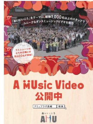
A Music Video【約14万回再生】動画はコチラ↓ https://www.youtube.com/watch?v=wdtJXSPCWIE