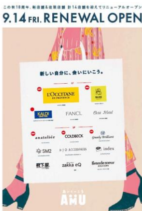
1・2階フロア リニューアル